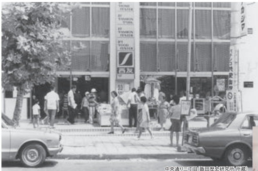
中央通り三丁目